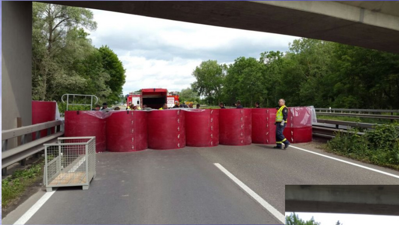
Hochwasserübung - Aufbau Aquariwa-System