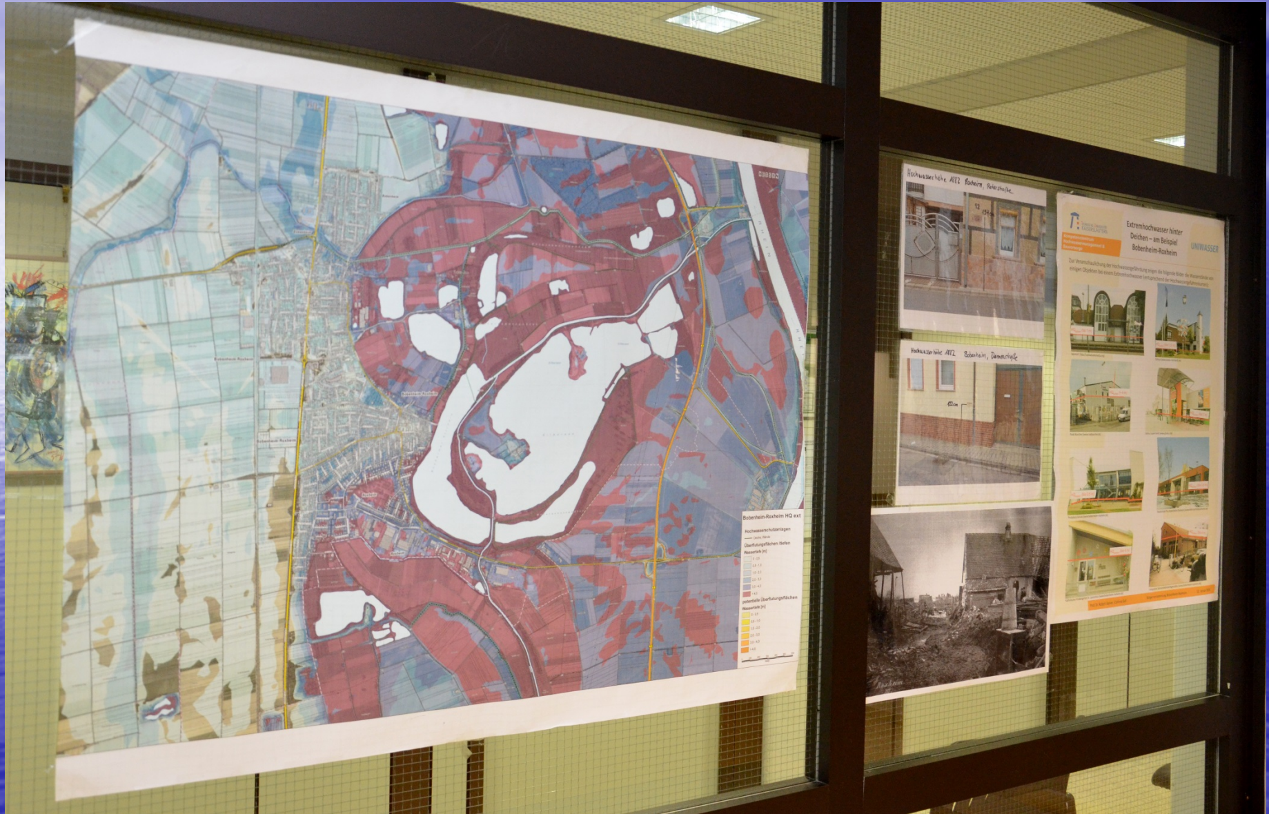
Ständiger Aushang im Rathaus zum Thema Hochwasser