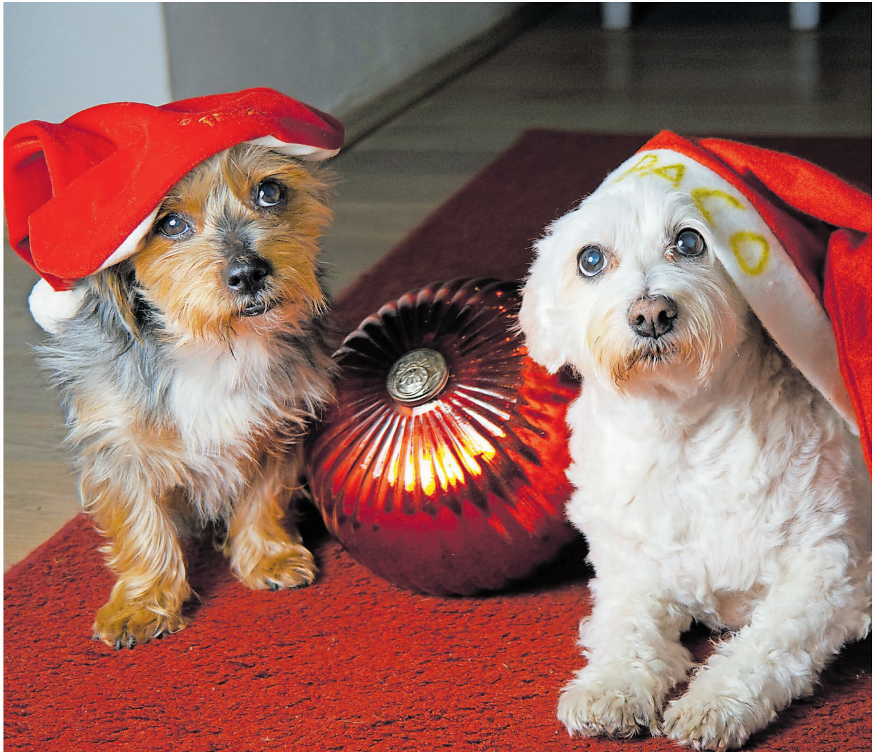
Tiere sind kein Weihnachtsgeschenk: Kehrt nach den Feiertagen wieder der Alltag ein, wird manchem frischgebackenen Tierhalter schnell klar, dass das einst ersehnte Haustier auch als lästig empfundene Arbeit mit sich bringt.