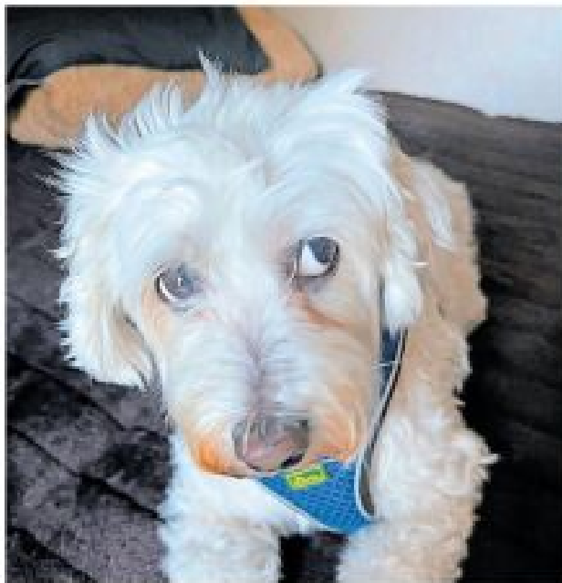
Obwohl die Tierheime im Auftrag der Kommunen Fundtiere aufnehmen und von den Ämtern beschlagnahmte Tiere übernehmen, werden die dafür anfallenden Kosten noch immer defizitär erstattet.