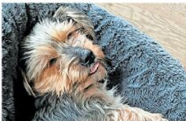
Nun kündigt sich die Herbstsaison an, eine Zeit des Wandels, die auch auf Haustiere eine Auswirkung hat.

Zeitumstellung. Wenn in diesem Jahr in der Nacht vom 28. auf den 29. Oktober die Uhren um eine Stunde zurückgestellt werden, ist die dunkle Jahreszeit endgültig angebrochen. Mit dem schwindenden Tageslicht und den fallenden Temperaturen kündigt sich die Herbstsaison an, eine Zeit des Wandels, die auch auf Haustiere eine Auswirkung hat. Die globale Tierschutzorganisation VIER PFOTEN teilt Ratschläge, wie Sie Ihr Heimtier optimal auf den Herbst vorbereiten können und diese Jahreszeit gemeinsam genießen. Langsam auf die Zeitumstellung vorbereiten „Die meisten Haustiere haben feste Routinen, insbesondere Hunde und Katzen haben sich an bestimmte Abläufe gewöhnt. In der Woche vor