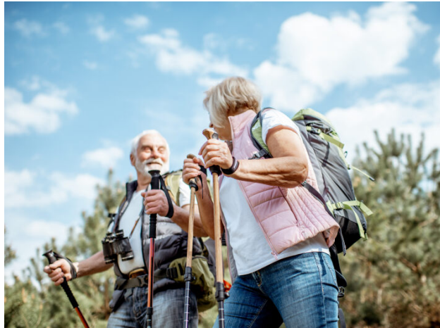
Bewusste Momente in der Natur beleben Körper und Geist.

Bewegung. Regelmäßige Bewegung kann viel zu einem langen Leben in guter Gesundheit beitragen. Dies gilt auch für ältere Erwachsene. Menschen ab 65 Jahren wird empfohlen, sich 150 bis 300 Minuten in der Woche ausdauernd zu bewegen und an mindestens zwei Tagen in der Woche Aktivitäten nachzugehen, um die Muskeln zu kräftigen. Ältere Menschen sollten darauf achten, an mindestens drei Tagen in der Woche ausreichend Übungen mit dem Fokus auf Gleichgewicht, Krafttraining und Koordination in ihr Bewegungsprogramm einzubauen, um die körperliche Leistungsfähigkeit zu verbessern und Stürze zu vermeiden. Wandern gehört ebenso wie Schwimmen oder Radfahren zu den Freizeitaktivitäten, die unsere Ausdauer fördern. Darüber hinaus trainiert Wandern die Muskulatur und den Gleichgewichtssinn. Der Vorteil: Wandern eignet sich auch für Menschen mit bereits bestehenden Einschränkungen. Durch die schonende regelmäßige Bewegung kann Wandern sogar zur Linderung von bereits bestehenden Krankheiten oder Beschwerden beitragen und