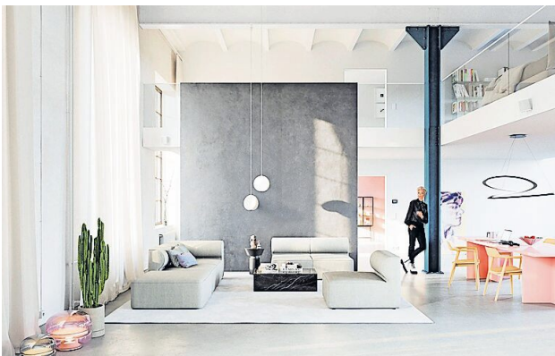
Lust auf mehr Großzügigkeit: Loftartige Räume verwöhnen die Bewohner mit viel Platz und gleichzeitig viel Behaglichkeit.

Wohnen. Eine großzügige Fläche ohne allzu viele störende Zwischenwände. Hohe Raumdecken, viel Glas für eine helle Atmosphäre mit Tageslicht sowie nahtlose Übergänge zwischen Küche, Wohnen und Homeoffice: Loftartige Wohnungen haben ihren ganz eigenen Charme und stehen hoch im Kurs, wenn es um das moderne, urbane Wohnen geht. Vielfach werden Neubauten nach dem Loft-Prinzip geplant und errichtet. Noch origineller wirken Wohnungen, die früher beispielsweise als Fabrik dienten und nun für eine neue Nutzung umgestaltet werden.