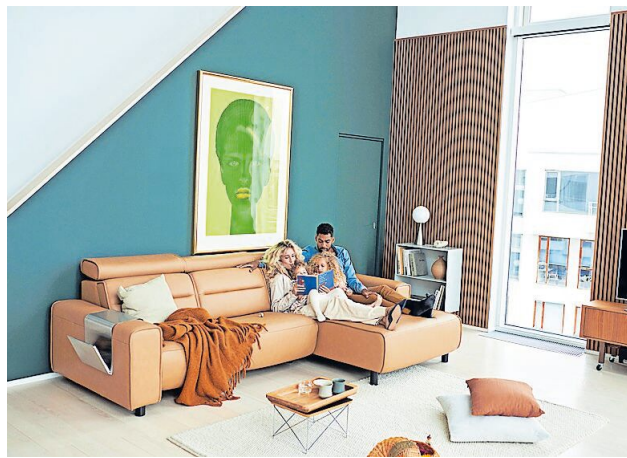
Gemeinsam kuscheln, lesen und entspannen: Großzügige Sofas bilden den gemütlichen Mittelpunkt des Familienlebens.

Wohnen. Die Welt da draußen aussperren, einfach mal abschalten und es sich mit der ganzen Familie gut gehen lassen: Das Sofa bildet den behaglichen Mittelpunkt des Zuhauses. Hier wird miteinander gekuschelt, gelesen, gespielt und vor allem viel gelacht. Den passenden Relaxbereich dafür schaffen großzügige Sitzlandschaften, die genug Platz für alle bieten und sich zudem immer wieder anderen Vorlieben und Wünschen anpassen lassen.