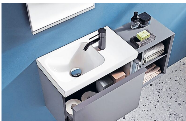
Handwaschbecken mit seitlich versetzter Wasserarmatur und passende schlanke Badmöbel nutzen den Platz auf kleinen Badgrundrissen optimal aus.

Waschtische mit geringer Tiefe Mit cleveren Ideen machen sich Waschtische klein und schlank und bleiben dennoch gut nutzbar. Eine an der Seite statt hinten platzierte Hahnlochbank etwa verringert die Tiefe des Waschbeckens und Ecklö-