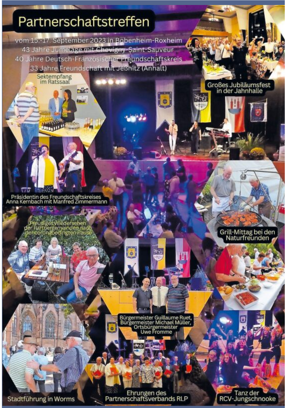
Sektempfang im Ratssaal

vom 15.-17. September 2023 in Bobenheim-Roxheim 43 Jahre Jumelage mit Chevigny-Saint-Sauveur 40 Jahre Deutsch-Französischer Freundschaftskreis 33 Jahre Freundschaft mit JEBnitz (Anhalt)