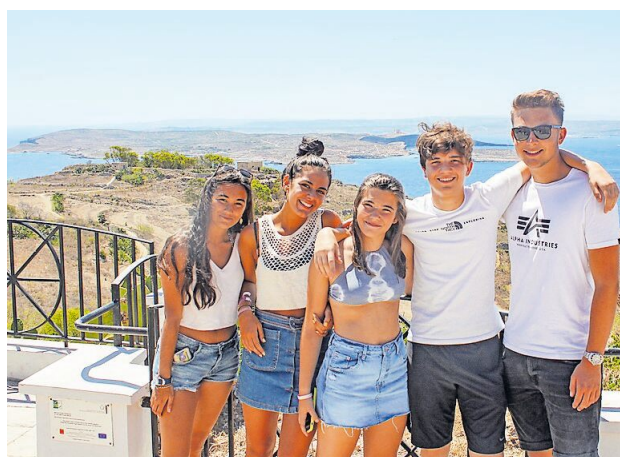
Es gibt viele Gründe, um nach Malta zu fahren - zum Beispiel die kleine Insel Comino, die im Hintergrund zu sehen ist.

Da Malta Teil der EU ist, können Bürgerinnen und Bürger anderer EU-Länder wie Deutschland dort ohne