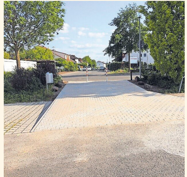
Notzufahrt vom Parkplatz Jahnhalle zum Gewerbegebiet In den Fuchslöchern