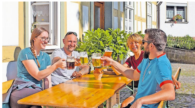
Erst die Bewegung, dann das Bier. Die Einkehr in einer Brauerei ist ein gelungener Abschluss einer Bierwanderung.

Hopfen und Malz kann man besonders gut bei einer Brauereiwanderung erleben. Es geht durch die Täler von Main, Lauter oder Itz und auf die Höhen von Staffelberg und Co. - in Verbindung mit so manchem Brauereibesuch. Wer von allen elf Brauereien in Bad Staffelstein einen Stempel erhalten hat, darf sich sein Bierdiplom abholen. Auf den Routen werden die Basilika Vierzehnheiligen und Kloster Banz sowie malerische Fachwerkdörfer passiert. Brauereitouristen gibt es auch für Radler, man findet sie unter www.bad-staffelstein.de oder auf dem Routenplaner-Portal Komoot. Krönen lässt sich eine Biertour etwa mit einem Bierseminar im Rosenauer Hofbräu in Marktgraitz oder einer Brauereibesichtigung in der Braumanufaktur LipPERT in Lichtenfels. Einen Eindruck